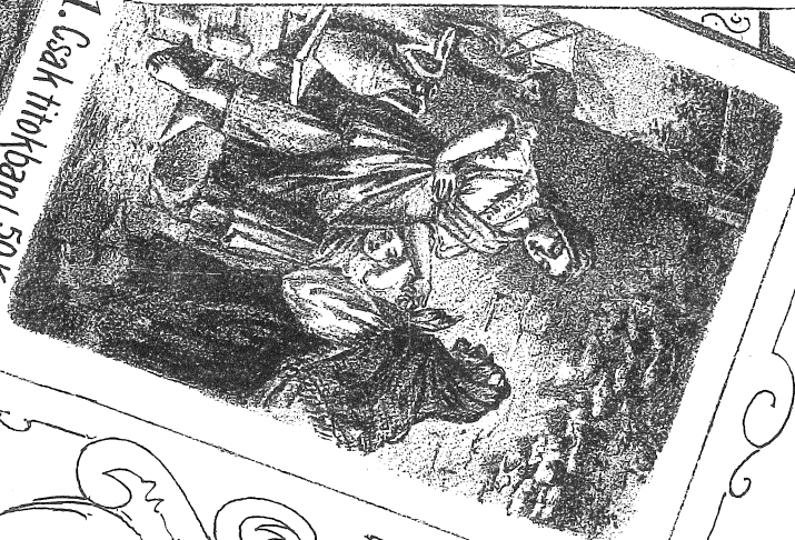
1. Csak tiokban! 50Kr. 1Mk.