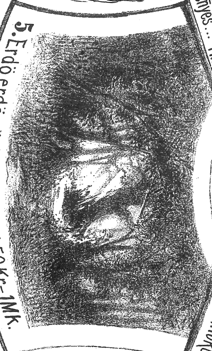
5. Erdő, erdő sűrű erdő...! 50Kr.-1Mk.