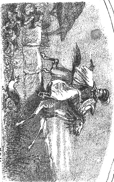
4. Be sok falut, be sok várost bejártam..! 50Kr. 1Mk.